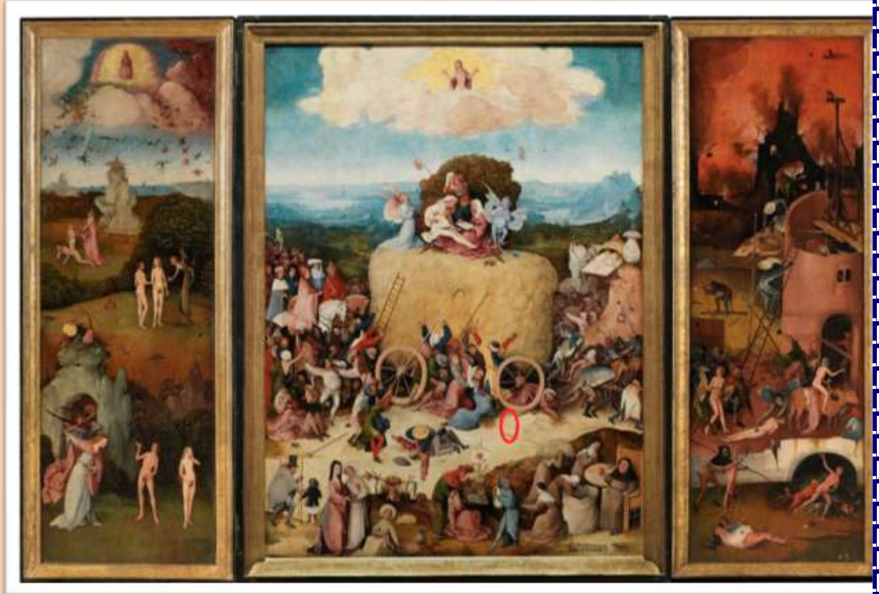
El Carro de heno