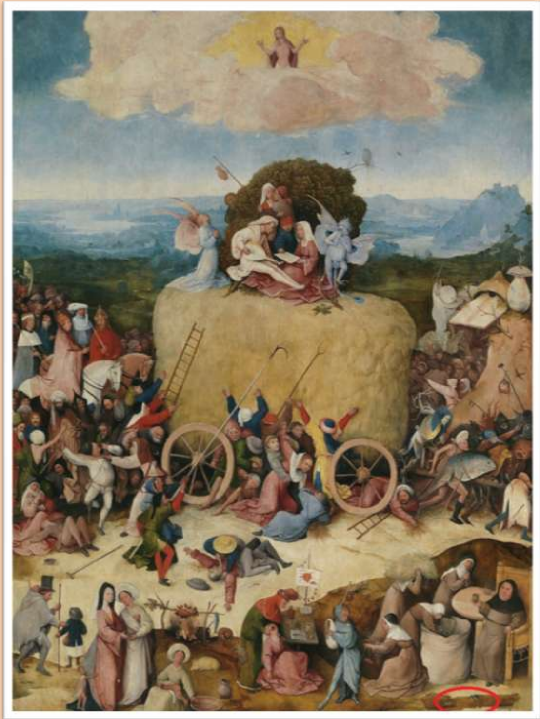
Central del Carro de heno