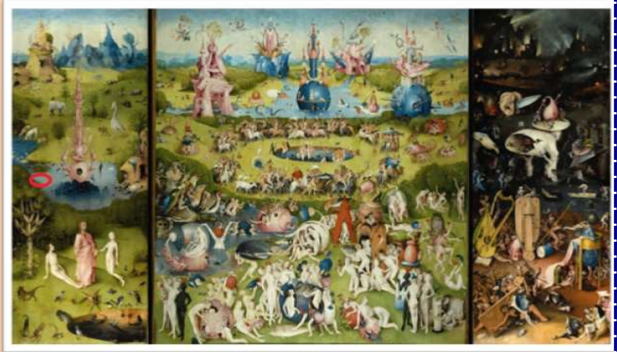
El jardín de las delicias