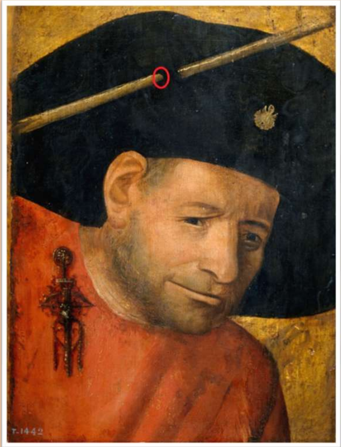
Cabeza de un ballestero