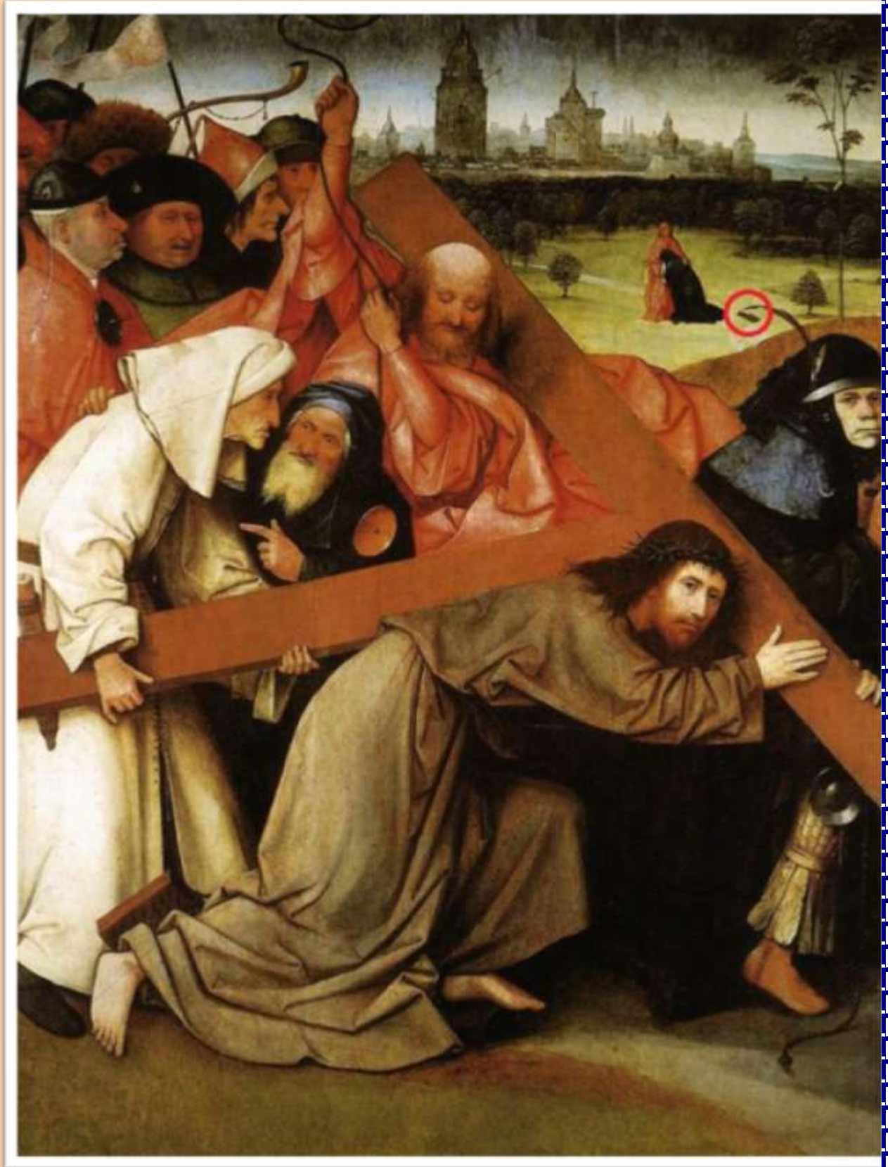
Crísto con la Cruz a cuestras