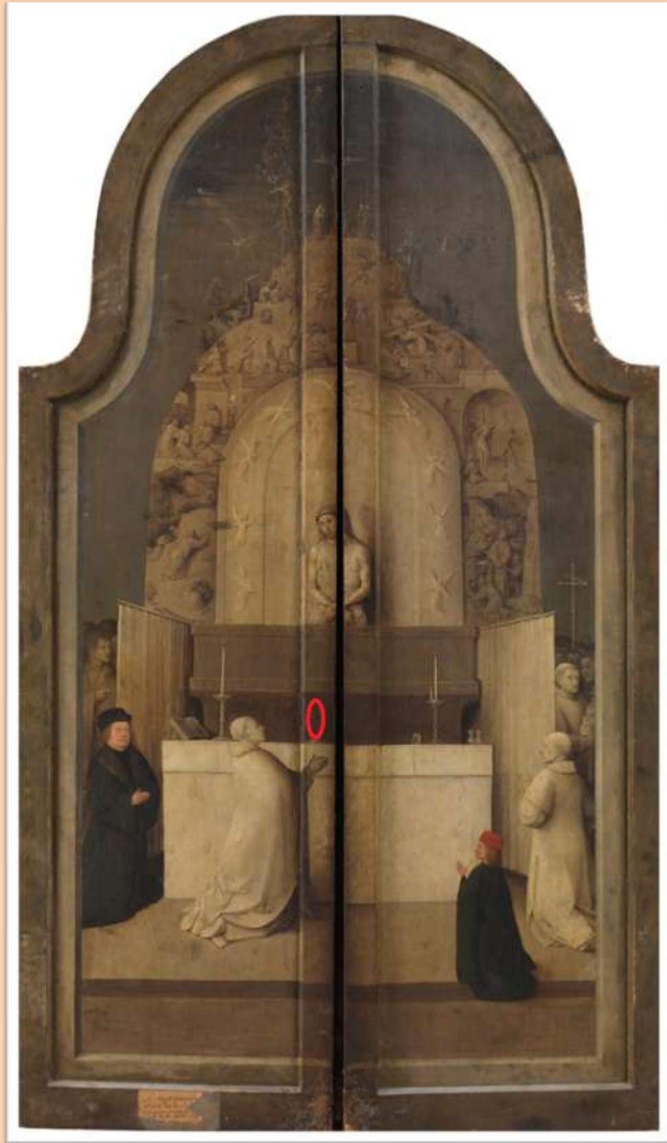
Reverso de La Adoración de los Magos