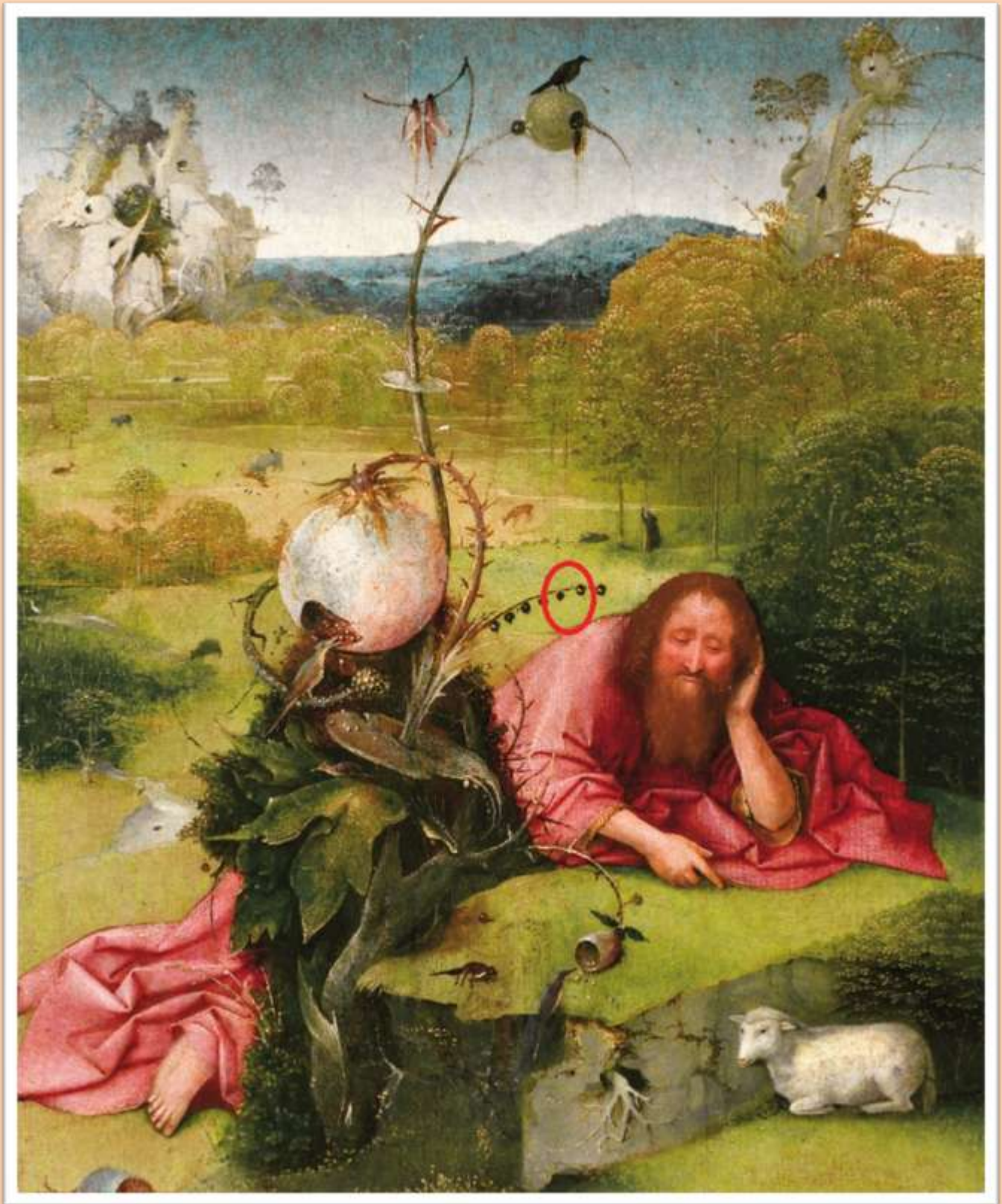
San Juan Bautista en el desierto