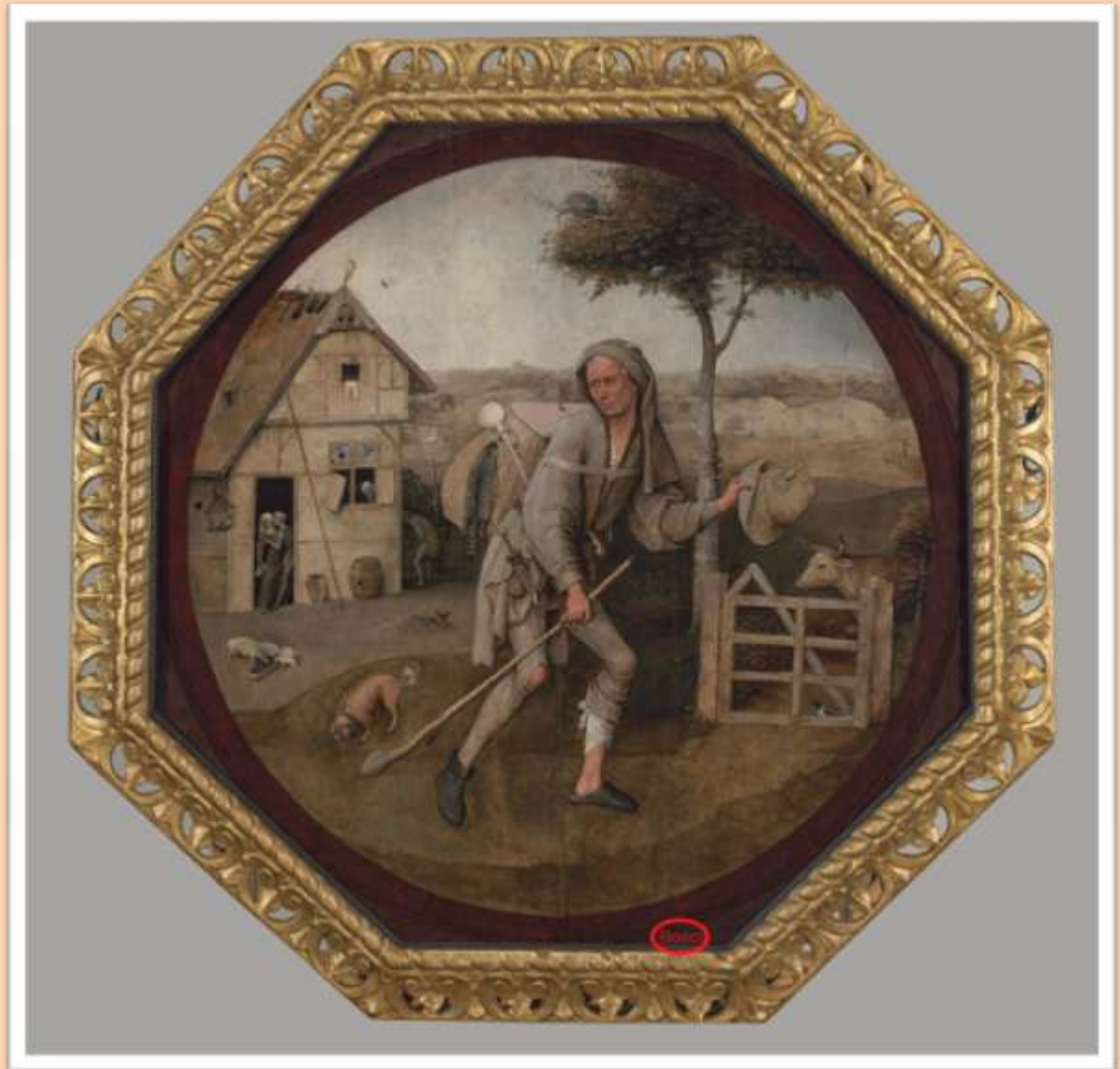
El camino de la vida o El vendedor ambulante