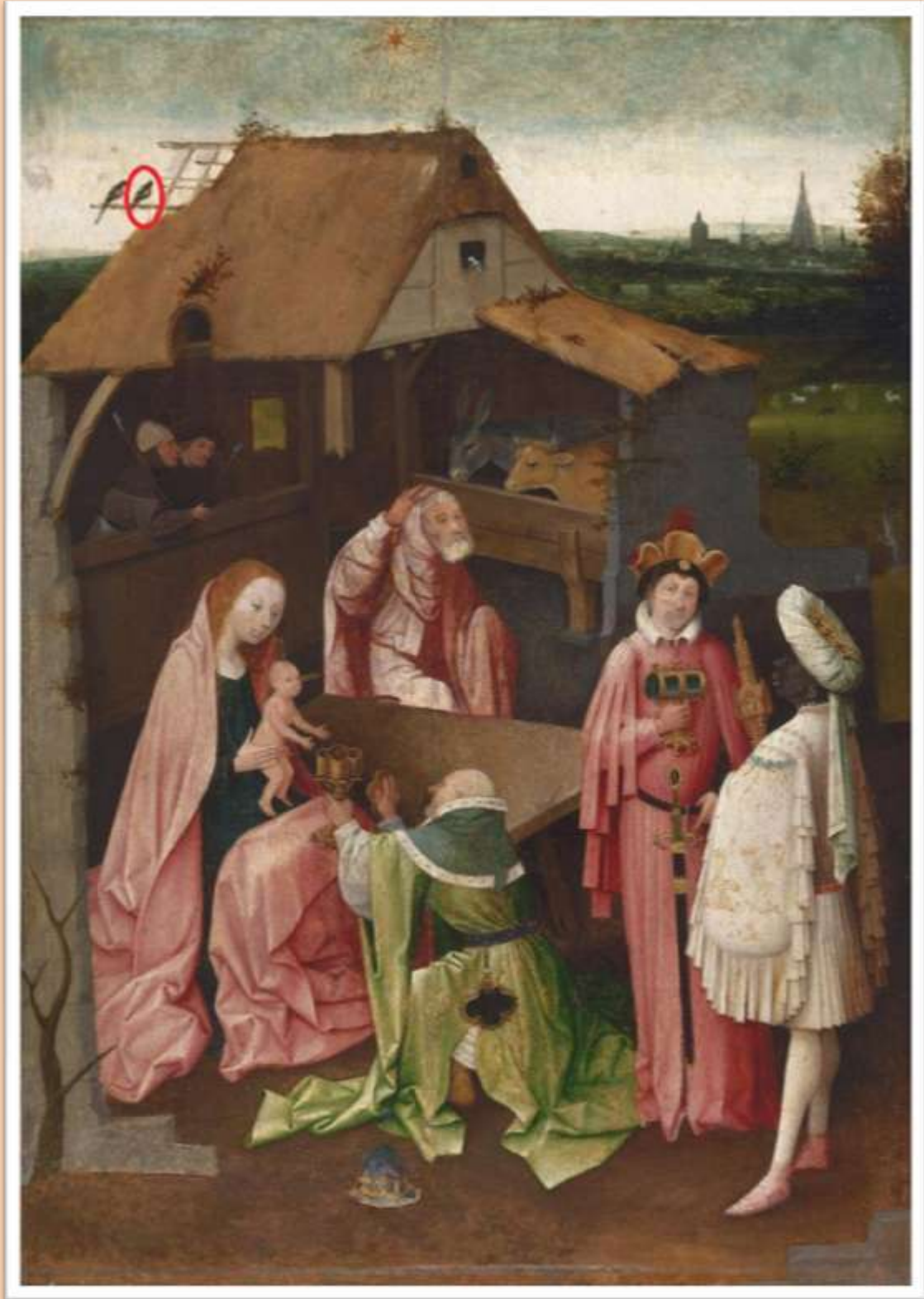
La adoración de los Magos