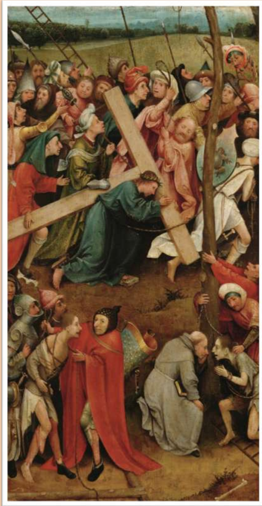
Camino al Calvario