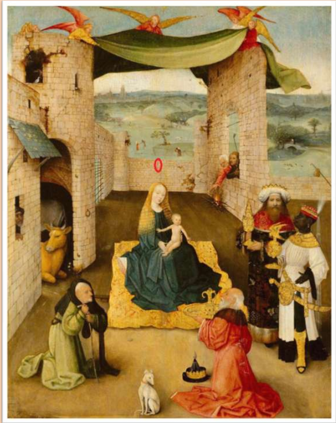
Adoración a los Reyes Magos