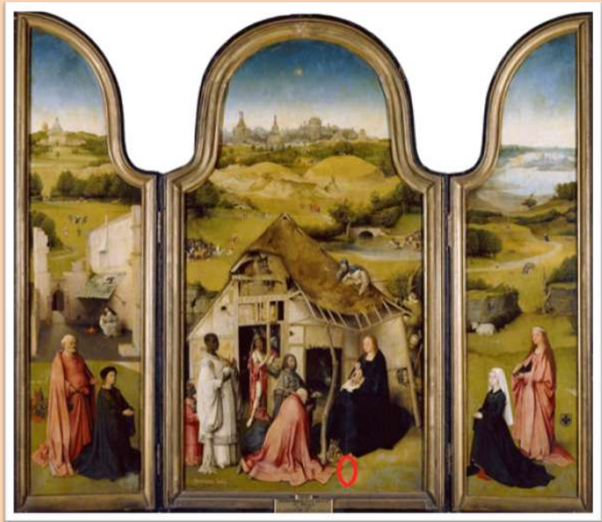
La adoración de los Magos